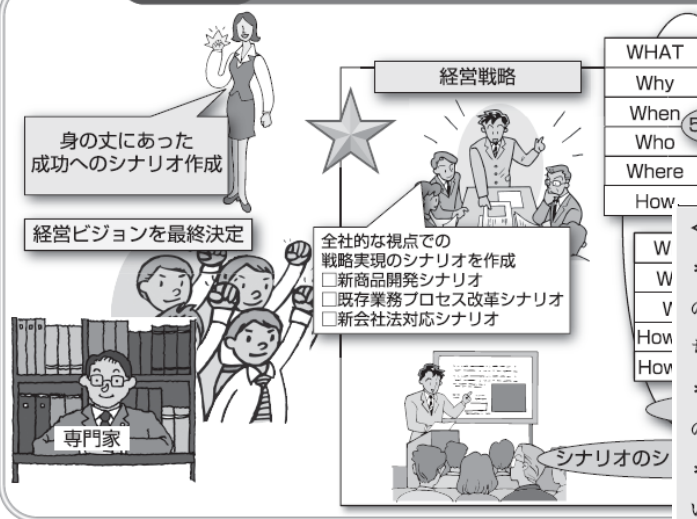
図表3-2-32 経営戦略の策定

・使命との整合性の確認を行います。経営環境分析 が利用されます。 の強みと弱み、現状のコアコンピタンスと環境変化 を抽出することです。 確認が欠けていたり、または不足していたりする場 ためのインタビューを実施することが重要です。 の変化に対する事業機会、脅威の検討には、SWO (strength: 強み、opportunity: 機会、threat: 脅威) 分 経営組織、人材、財務力、研究開発力、マー ーリ、外部環境には、経済、政治、自然などの どのマイクロ環境に関するものがあります。 に関しては、1.企業理念・使命の確認から導 ・、3.内部環境情報収集でのバリューチェーン